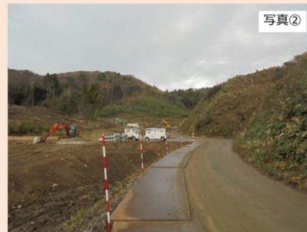
旧輪島市道（②地点）から北東方向（覆土仮置場予定地）を撮影したものです。 主に伐採工事を行っています。