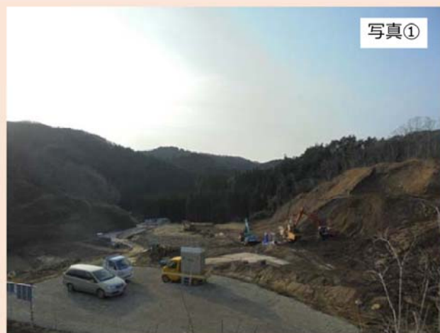
現場内に設けた見学場所（①地点）から西方向（出入口方向）を撮影したものです。 先月に引き続き、防災調整池付近の造成工事を行っており、加えて濁水対策を強化するための工事を行っています。