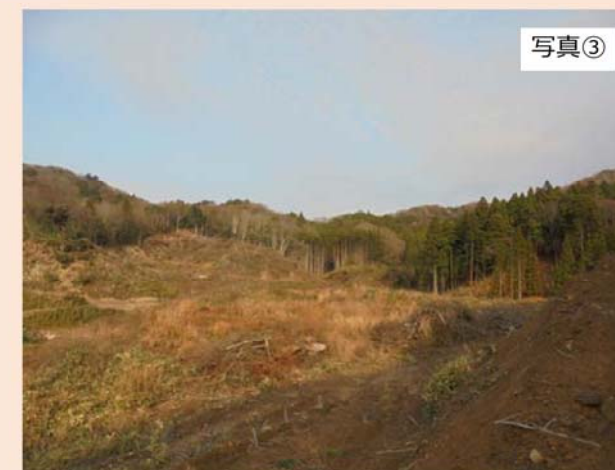
埋立地南側の斜面（③地点）から北東方向（第1期埋立地予定地）を撮影したものです。 12月2日より、伐採工事を再開しました。