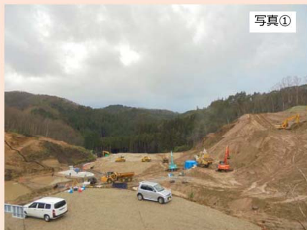
現場内に設けた見学場所（①地点）から西方向（出入口方向）を撮影したものです。 先月に引き続き、防災調整池付近の造成工事を行っており、加えて濁水対策を強化するための工事を行っています。