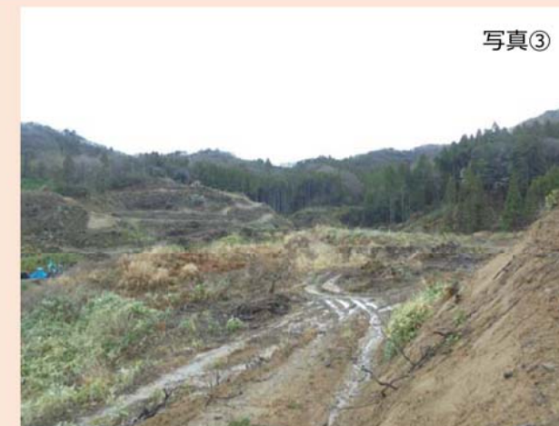
埋立地南側の斜面（③地点）から北東方向（第1期埋立地予定地）を撮影したものです。 現在、濁水対策工事を優先し工事を進めています。