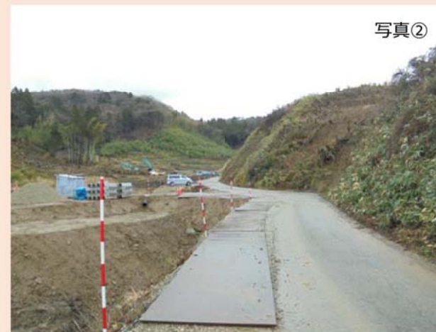
旧輪島市道（②地点）から北東方向（覆土仮置場予定地）を撮影したものです。 現在、濁水対策工事を優先し工事を進めています。