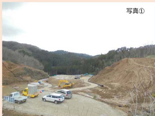
現場内に設けた見学場所（①地点）から西方向（出入口方向）を撮影したものです。 先月に引き続き、防災調整池付近の造成工事を行っており、加えて濁水対策を強化するための工事を行っています。