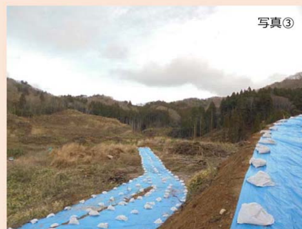
埋立地南側の斜面（③地点）から北東方向（第1期埋立地予定地）を撮影したものです。 現在、濁水対策工事を優先し工事を進めています。