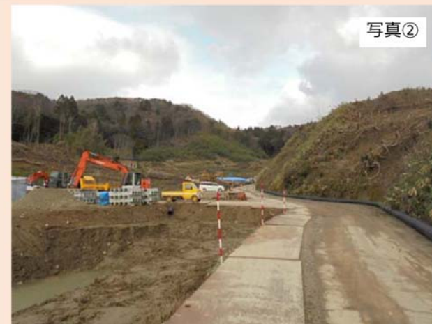
旧輪島市道（②地点）から北東方向（覆土仮置場予定地）を撮影したものです。 現在、濁水対策工事を優先し工事を進めています。