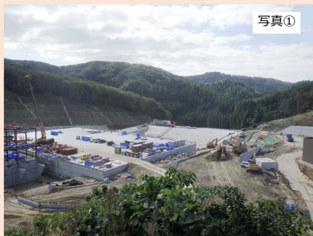
改変区域の中央（①地点）から西方向（出入口方向）を撮影したものです。 先月に引き続き、浸出水処理施設付近の工事を行っております。