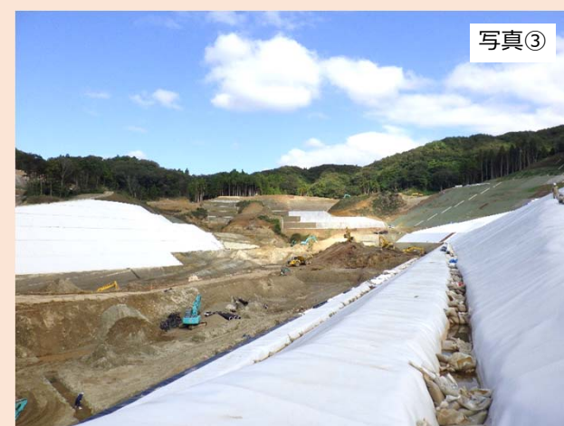
埋立地南側の斜面（③地点）から北東方向（第1期埋立地予定地）を撮影したものです。 埋立地付近の造成工事を行っております。