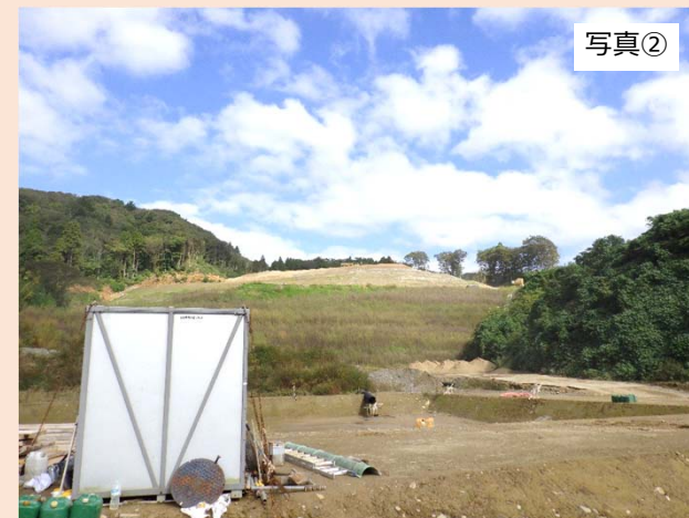
旧輪島市道（②地点）から北東方向（残土仮置場予定地）を撮影したものです。 残土仮置場の造成工事を行っております。