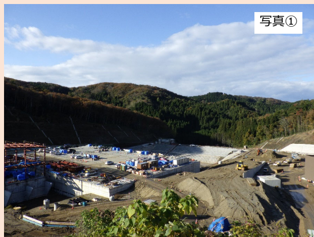
改変区域の中央（①地点）から西方向（出入口方向）を撮影したものです。 先月に引き続き、浸出水処理施設付近の工事を行っております。