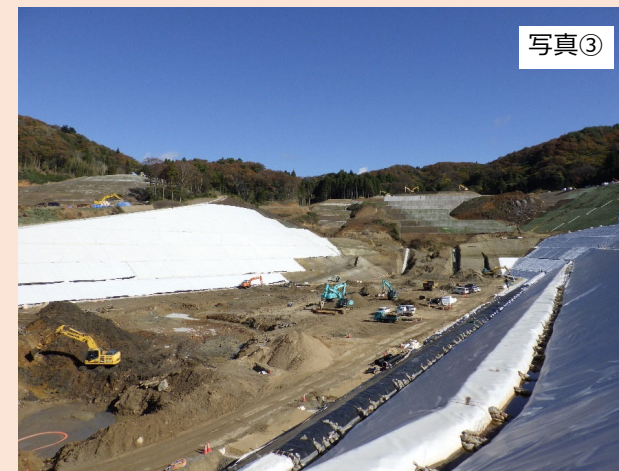
埋立地南側の斜面（③地点）から北東方向（第1期埋立地予定地）を撮影したものです。 埋立地付近の造成工事を行っております。