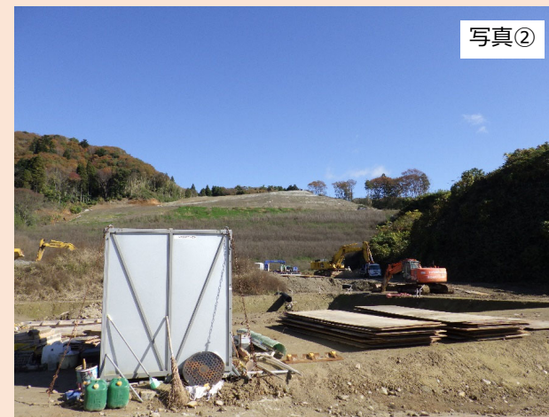
旧輪島市道（②地点）から北東方向（残土仮置場予定地）を撮影したものです。 残土仮置場の造成工事を行っております。