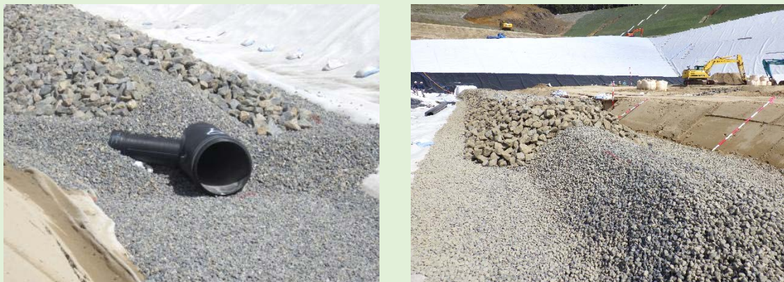
浸出水集排水設備の様子

埋立地から発生する廃棄物に触れた水（浸出水）は、浸出水集排水管により速やかに集排水され、浸出水調整設備へ流下されます。浸出水集排水管は、目詰まりを防止するために栗石等の被覆材を組み合わせて埋設されます。