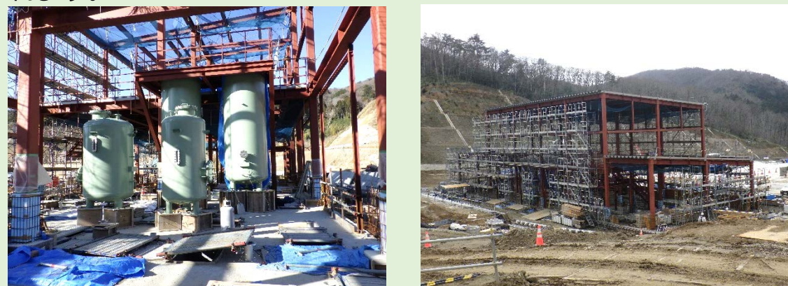
浸出水処理設備の機器据付の様子

埋立地から発生する廃棄物に触れた水（浸出水）は、浸出水処理設備において、凝集沈殿、生物脱窒素処理、高度処理を行い、水の濁りや汚れ、重金属類やダイオキシン類その他の有害な化学物質が取り除かれます。