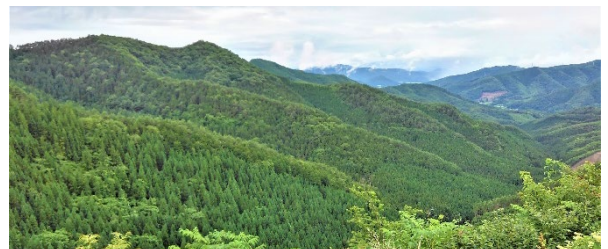
花巻市内に保有する社有林

タケエィ林業が岩手県花巻市内に保有する約240ヘクタールの山林について、花巻市森林組合と協同で森林経営計画を作成し、認定を受け、本格的に森林施業を開始しました。この計画に基づき、2022年から2027年にかけて主伐および間伐を行うほか、岩手県が誇るカラマツの植林にも取り組みます。この取組みにより、発電燃料となる未利用材の調達からチップ化・供給、そしてグループ内での発電および売電までの一貫体制を実現しました。林業の再生・活性化に寄与するとともに、限りある森林資源を次世代につなぐ役割を果たします。