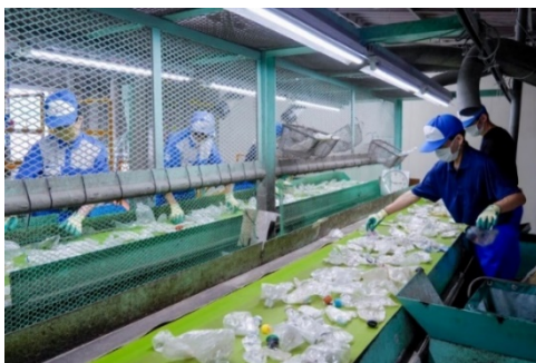
ペットボトル選別の様子

㈱タッグは、1999年に創業して以来、北海道・東北6県を中心に、容器包装リサイクル法に則ったプラスチック廃材の再商品化事業に取り組んでおります。また、東北地方で最大級のペットボトルリサイクル設備を保有しており、プラスチック廃材を再生原料化するだけでなく、新規性のある再生製品の開発・製造・販売を通して、資源循環社会の構築やリサイクル産業の創出に寄与することを目指しています。