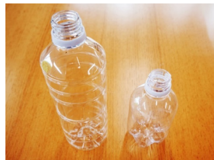
リサイクル製品(ボトル to ボトル)