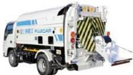
168 じゅもくはさいしゅうしゅうしゃ 樹木破碎収集車