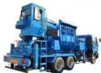
238 いどうしきはいしゃプレスしゃ 移動式廃車プレス車