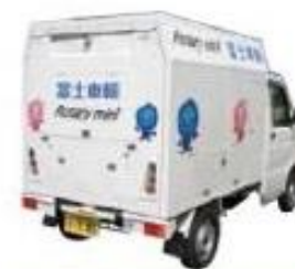
166 ミニごみしゅうしゅうしゃ