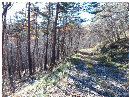
アカマツ・広葉樹の混交林