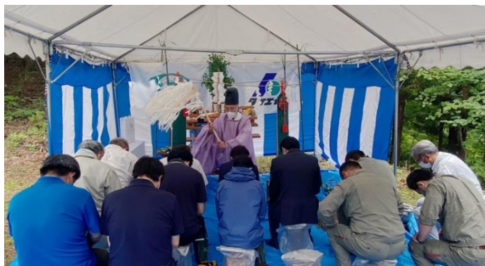
安全祈願祭の様子