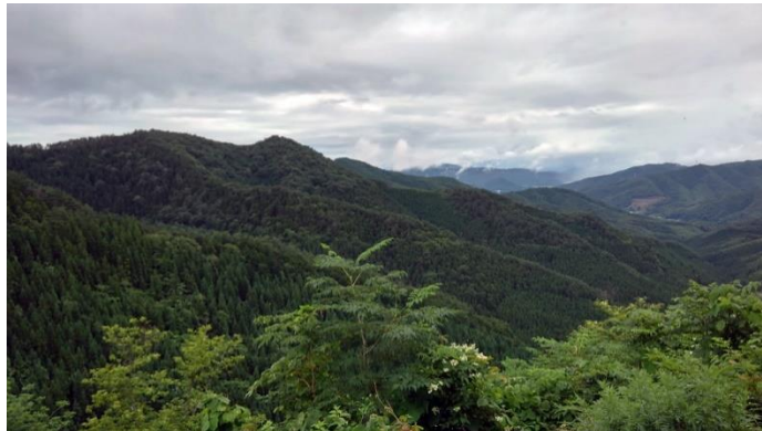
岩手県花巻市に取得した約 240 ヘクタールの山林